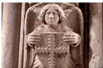
S4 Anděl s vrubovaným křížem

Kromě toho, že se jedná o odkaz na Krista, Beránek Boží byl symbolem templářského řádu, jehož cílem bylo chránit poutníky cestující do Svaté země během křížových výprav.