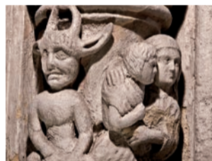
S1 Dábel a milenci

Tato plastika pravděpodobně představuje zakladatele kaple Williama St Claira. Ten začal s výstavbou Rosslynské kaple v roce 1446, ale zemřel v roce 1484, ještě před jejím dokončením.