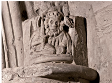
Z2 William Zakladatel

Stejně jako kukuřice a aloe vera je i trojčетка jednou z exotických rostlin zpodobněných v kapli. Roste v Severní Americe a Asii.