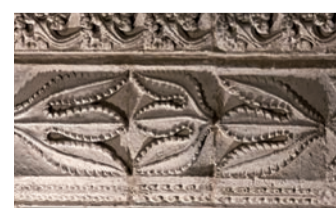
J7 Aloe Vera