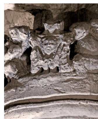
J5 Závoj svaté Veroniky

Toto okno, odhalené v roce 2021, bylo navrženo Joe Tilsonem RA (1928–2023) a připomíná 25. výročí založení fondu Rosslyn Chapel.