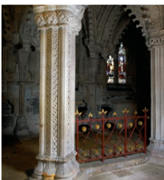
V6 Mistrův sloup

Tato sochařská práce ve tvaru osmicípé betlémské hvězdy znázorňuje Marii, Josefa, Ježíška, tři krále a tři pastýře po jejich stranách.