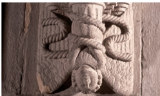
V3 Padlý anděl

Nezapomeňte chvíli postát v kapli a rohlédnout se kolem. Je tu ještě spousta dalších tesaných plastik k vidění!