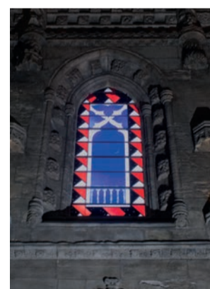
J4 Tilsonovo okno

Na druhé části morálního ponaučení na tomto překladu jsou znázorněny smrtelné hříchy, kterých by se lidé neměli dopouštět, včetně chamtivosti, hněvu a obžerství.