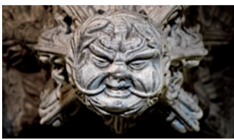
V4 Zelený muž (vyčnívající)

Tato neobvyklá kamenická plastika údajně představuje Samyazu, vůdce padlých andělů, který byl vyhnán z nebe. Někdy se mu říká Lucifer.