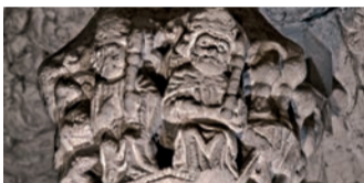
V5 Zrození Krista (nahore)

Rosslynská kaple je známá svými četnými reliéfy Zeleného muže. Vinná réva vyrůstající z úst postavy symbolizuje růst a plodnost přírody.