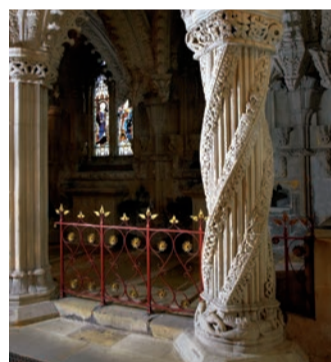
V7 Učedníkův sloup

Tento sloup vytesaný mistrem kameníkem je mnohem jednodušší než složitě tesaný sloup učedníka (viz V7), což možná vysvětluje, proč se kamenický mistr žárlivosti tolik rozrušil.