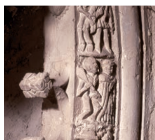
V1 Tanec Smrti

Rytina rytíře v kamenné desce na podlaze by mohla představovat sira Alexandra Sutherlanda, tchána Williama St Claira, který Rosslynskou kapli založil.