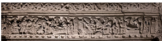
J2 Sedm skutků milosrdenství

Předpokládá se, že se jedná o kukuřici, která roste v Severní Americe.