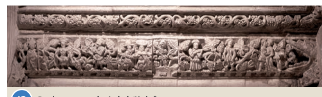
J3 Sedm smrtelných hříchů

Na druhé části morálního ponaučení na tomto překladu jsou znázorněny smrtelné hříchy, kterých by se lidé neměli dopouštět, včetně chamtivosti, hněvu a obžerství.