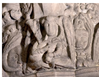
V2 Anděl s dudy

Tyto postavy jsou zachyceny v tzv. "Tanci smrti" Všimněte si kostlivců, kteří tlačí a táhnou zdráhající se osoby, aby se setkali se svým osudem. Plastiky symbolizují nevyhnutelnost smrti.