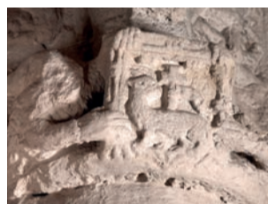
S3 Beránek Boží

Žebřík v pozadí tohoto kamenického díla naznačuje, že znázorňuje Kristovo sesazení z kříže.